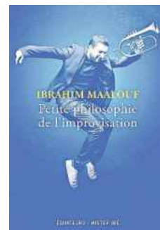
Ibrahim Maalouf : Petite philosophie de l'improvisation , 247 p., € 18.00, Éditions Équateur/Mister Ibé, Paris 2021, ISBN 978-2-3828-4196-9